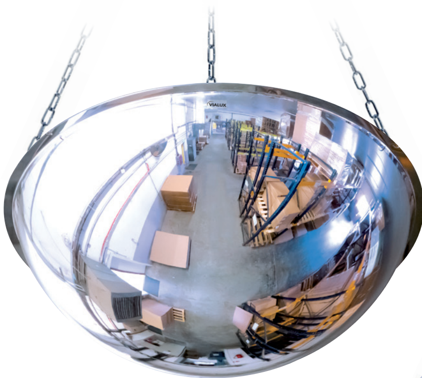
1/2 kuli w poziomie z PMMA