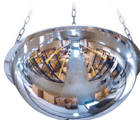
1/2 kuli w poziomie z Poliwęglanu (nietłukąca) wyposażone w otwór pozwalający na odpływ wód pochodzących z automatycznych systemów gaśniczych (sprinklerów).