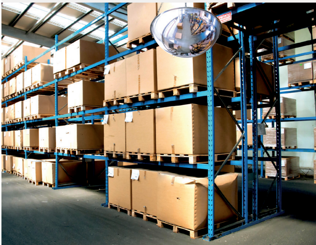
Lustro nr kat. 3680, Ø 800 mm