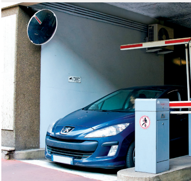
Lustro nr kat. 916, Ø 600 mm